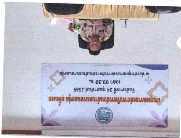
การประชุมสภาองค์การบริหารส่วนตำบลหนองทุ่ม ครั้งแรก ณ ห้องدار ที่ 24 กุมภาพันธ์ 2569 เวลา 09.30 น. ณ ห้องประชุมสภาองค์การบริหารส่วนตำบลหนองทุ่ม